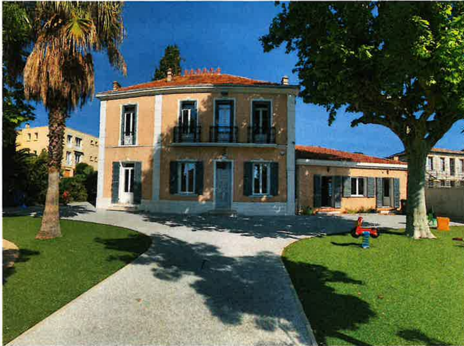
Bâtisse principale de l'ACMSH GRAC

L'accueil à l'ACMSH GRAC peut être également organisé dans les établissements suivants :