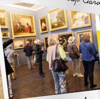
Musée des Beaux-Arts