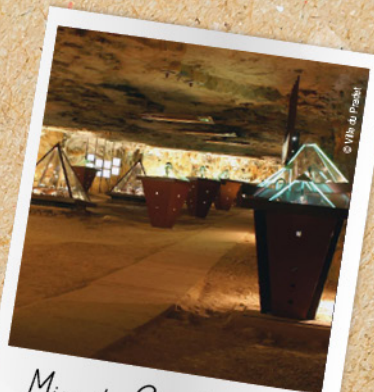
Mine du Cap Garonne